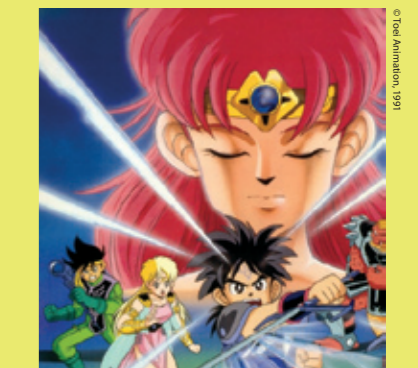
Dai no Daiboken on yksi Dragon Quest ien pohjalta tehdyistä anime- ja mangakokonaisuuksista.

Dragon Quest it eivät ole koskaan edustaneet konsoliteknologian huiminta kärkeä, eikä niitä voi hyvällä tahdollakaan kuvailla cooleiksi, katu-uskottaviksi tai mediaseksikkäiksi. Japanissa kokonainen pelaajasukupolvi on kuitenkin kasvanut tietäen, että kun nostalgia iskee tai kaipaa jotakin turvallista pelattavaa, Dragon Quest eihin voi aina luottaa. ■