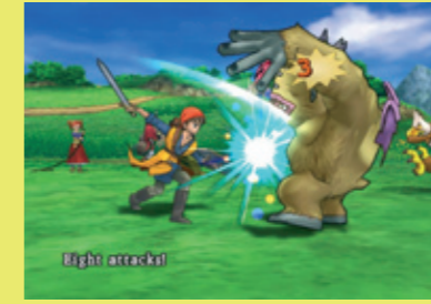
Pelisarjan saapumista Eurooppaan saatiin odotella sarjan kahdeksanteen osaan asti.