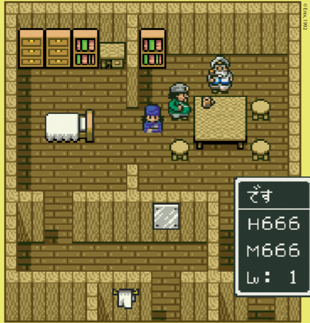
Dragon Quest 5 on yksi sarjan suosituimmista peleistä, mutta sitä ei silti julkaistu länessä.

Ensimmäinen Dragon Quest julkaistiin Yhdysvalloissa vuonna 1989, eli kolme vuotta myöhemmin kuin Japanissa. Kolmessa vuo-