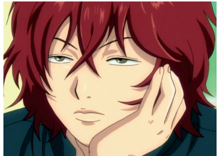
■ Shin murjottaa