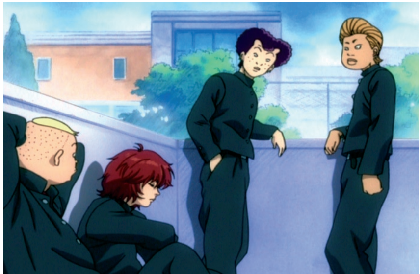
■ Koulun pojat vauhdissa